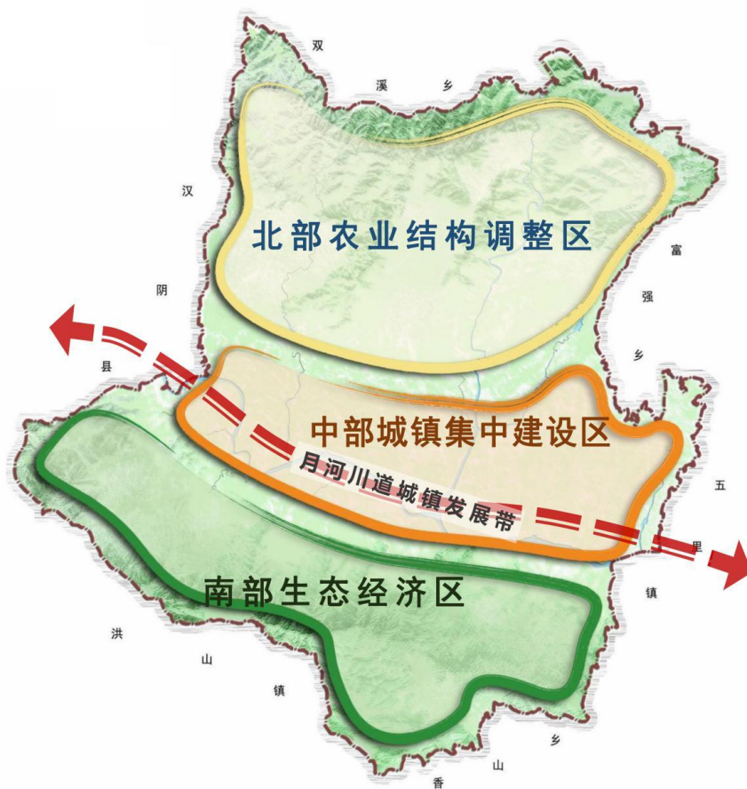
图 4-1 恒口示范区（试验区）全域产业布局图

城市会客厅、恒口工业园区、休闲旅游康养区、飞地经济园区、大同都市农业区”等板块构成。